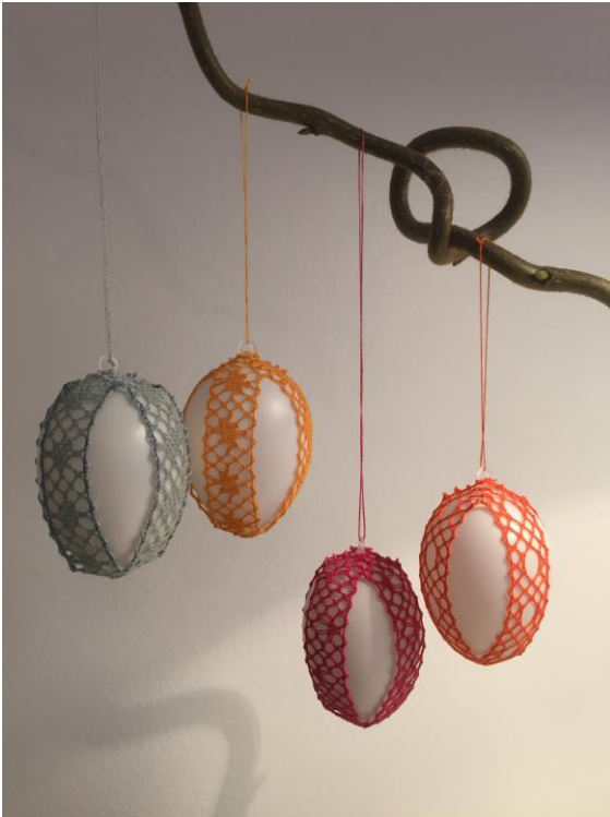
Fra Kniplebrevet Nr. 142 februar 2021