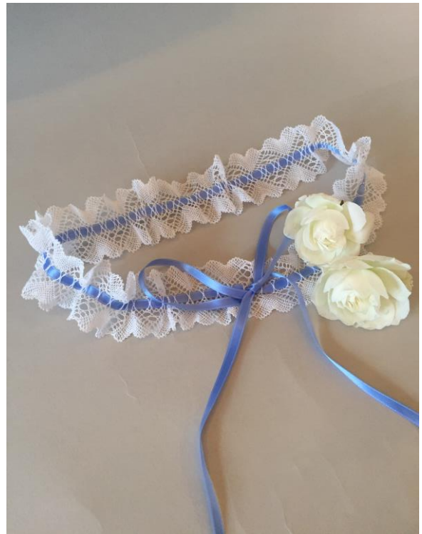
Fra Kniplebrevet Nr. 142 februar 2021